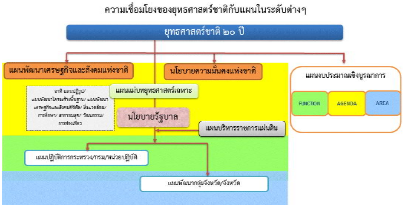
รูปภาพที่ 3 : ความเชื่อมโยงของยุทธศาสตร์ชาติกับแผนในระดับต่างๆ